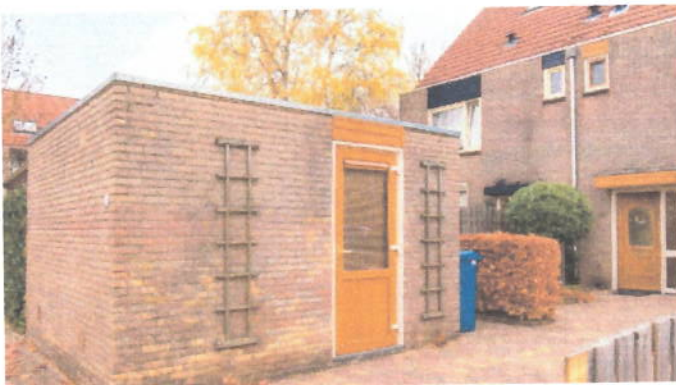
Hoe het nu is...