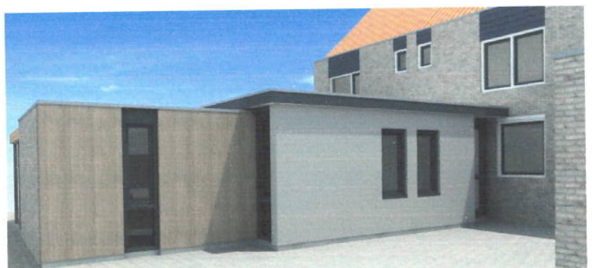
Hoe het wordt...

Familie en vrienden reageerden welwillend, maar toch ook verbaasd op ons besluit. Alweer verhuizen? En waarom dan naar een plaats waar jullie niemand kennen? Het is inderdaad nog maar een paar jaar geleden dat we samen van Dordrecht naar Hendrik-Ido-Ambacht trokken. Dat was om daar onze psychologenpraktijk AnderZ op te zetten. Een bijzonder bevredigende ervaring! Het was een voorrecht om met 128 personen een behandeltraject aan te gaan. Sommigen legden daarvoor zelfs een forse afstand af, al kwamen de meesten - 81 mannen en vrouwen (63%) - uiteraard uit regio Drechtsteden. Hopelijk kunnen we hier ook betekenis voor mensen hebben; dat is nu nog toekomst.