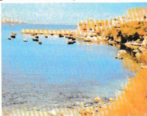
Impressie van de Paulusbaai bij het eiland Malta

Een goede biograaf benut natuurlijk ook de reeds beschikbare, geschreven bronnen en zorgt dat alle zinvolle gegevens in een leesbaar verhaal samenkomen. Lucas onderscheidt zich van de 3 andere evangelienschrijvers, doordat hij de betrouwbaarheid van zijn verslag verifieerbaar maakt met veel historische en geografische data. Zo schrijft alleen Lucas over het regeren van de keizers Augustus (27vC-14nC), Tiberius (14-37) en Claudius (41-54). Als niet-Jood verdiepte hij zich in joodse gebruiken en tijdsaanduidingen. Zo schrijft hij: 'Wijzelf voeren na het feest van het Ongedesemde brood weg uit Filippi' . Donderdag 14 april 57nC zou onze moderne datering voor het slot van dat Paasfeest zijn. En uit dat 'Wijzelf...' blijkt dat Lucas gedeeltelijk ooggetuige was van de gebeurtenissen die hij in Handelingen beschrijft. Het is intrigerend hoe hij als reisgenoot van Paulus overstapt